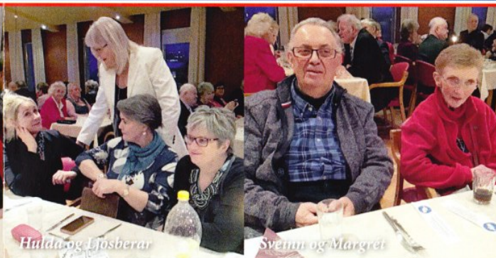
Húla og Ljósberar