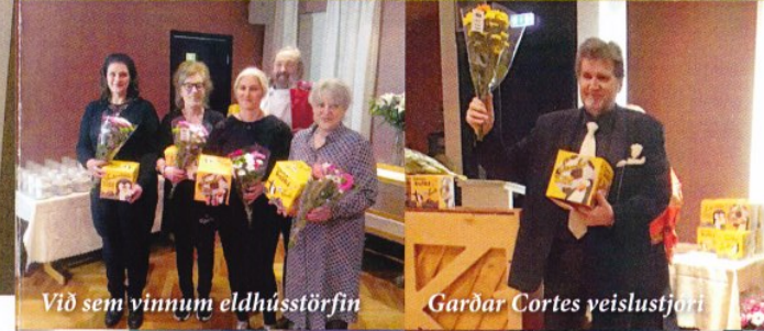
Við sem vinnum eldhússtörfin